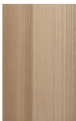
Frassino color sabbia