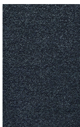
SANREMO - 11 - EXTRA