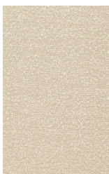
SANREMO - 26 - EXTRA